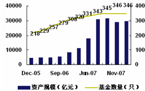
图表 8: 行业发展